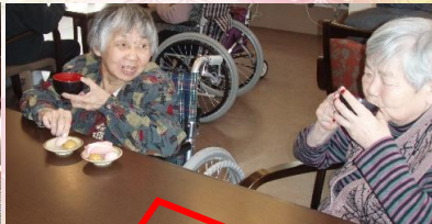
さくらのケーキと甘酒でお祝いました