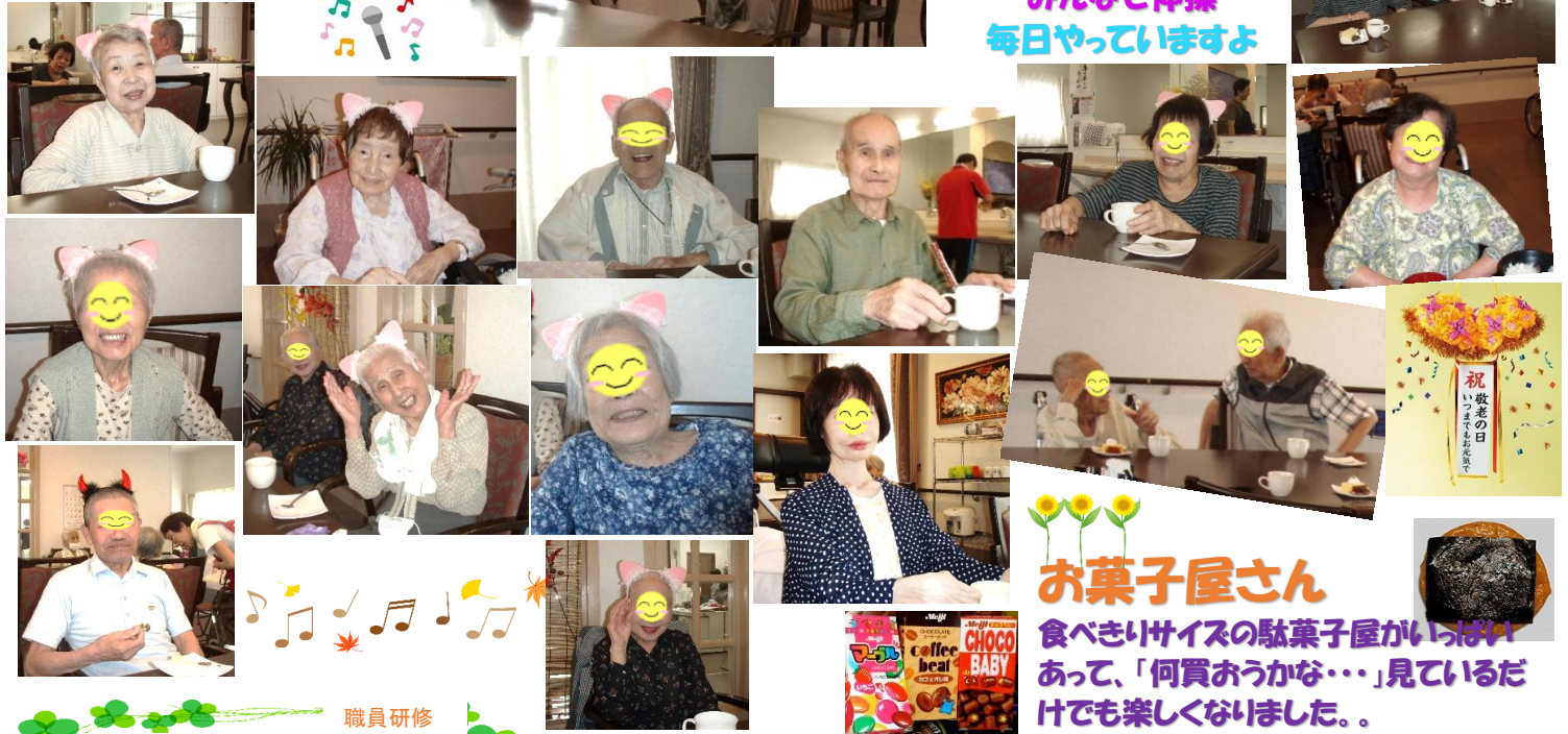
みんなで体操 毎日やっていますよ