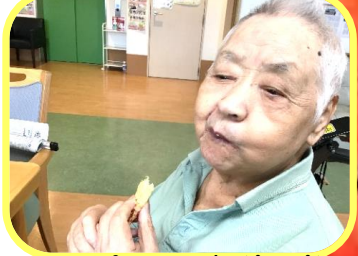
海老の天ぷら最高(^O^)