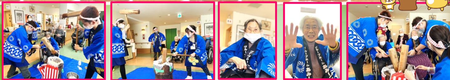
スタッフもぺったんぺったん頑張りました