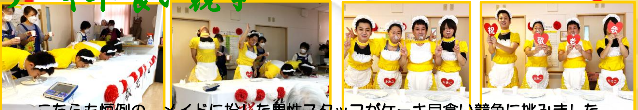
こちらも恒例の、メイドに扮した男性スタッフがケーキ早食い競争に挑みました 男性スタッフの姿に拍手喝采でした♪