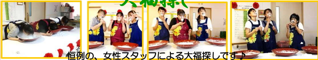
恒例の、女性スタッフによる大福探しです♪ 毎年参加しているスタッフは、コツを覚えとても早く見つけ出しました 髭を付け、顔を真っ白にしながら頑張りました(^)/