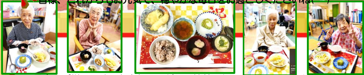
昼食のご様子です。お赤飯に天ぷらに抹茶のケーキ ご馳走に舌鼓です♪