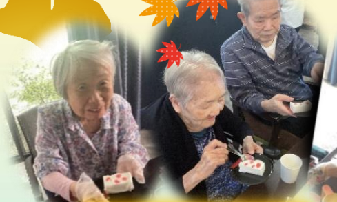
寒天作ってみました！