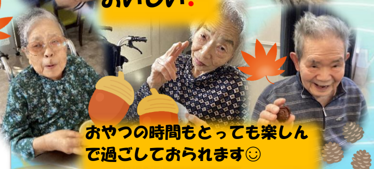
おやつの時間もとっても楽しんで 過ごしておられます😊