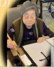
みなさんととも 達筆です！