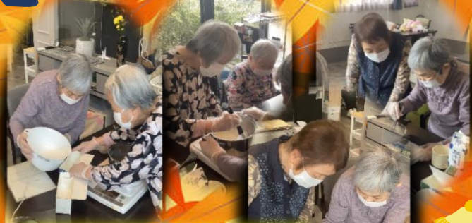
計って混ぜて本格的です！