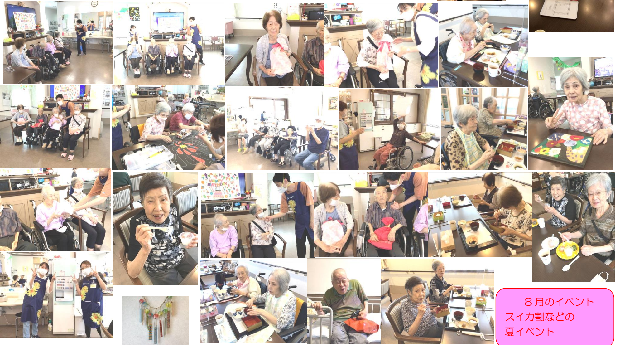
8月のイベント スイカ割などの 夏イベント