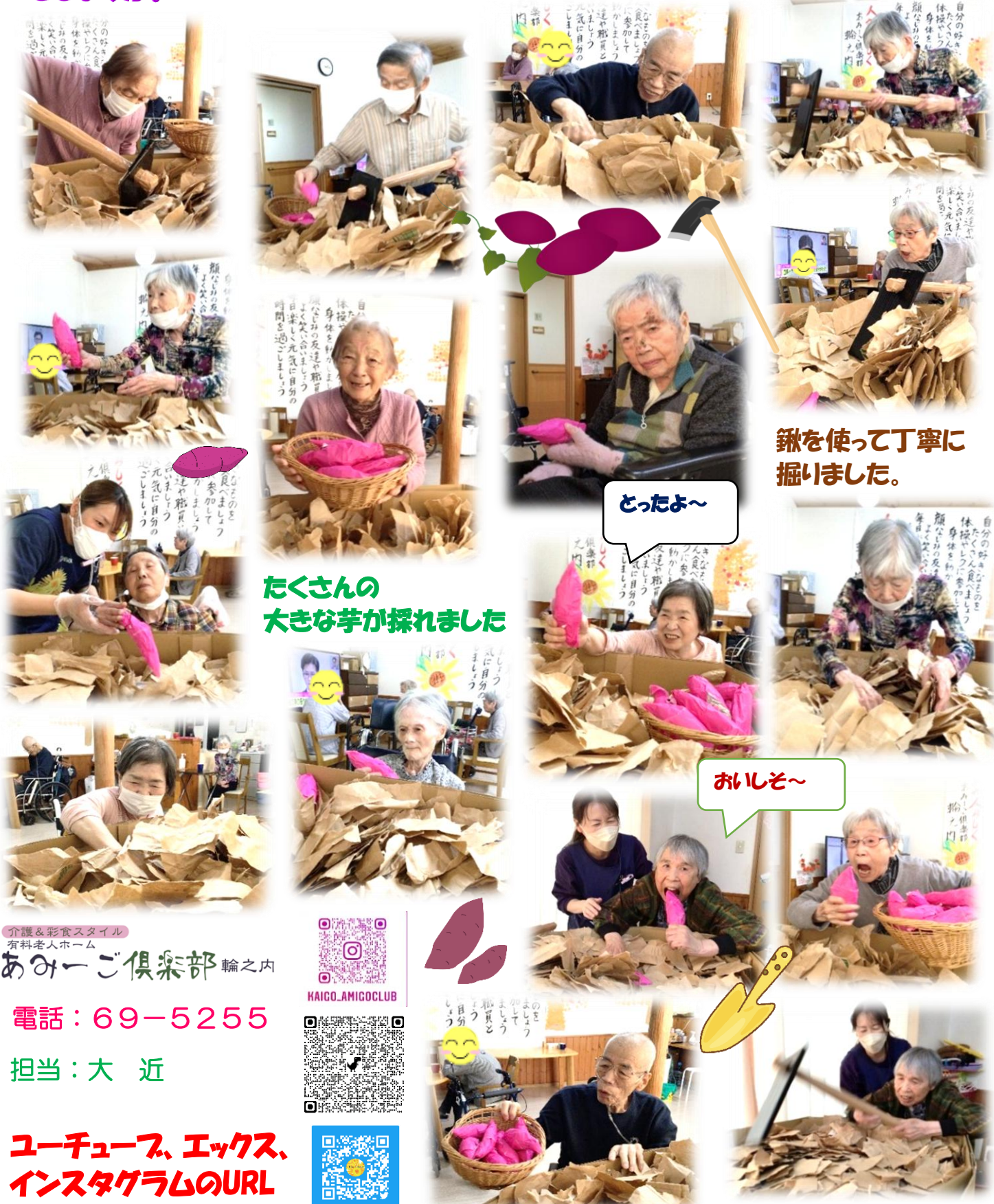
鍬を使って丁寧に掘りました。

秋は収穫の季節です。皆さん、施設内で芋ほりですよ。土の中からさつまいもを掘っていきます。安納芋、紅はるか、紅あづま、さあどんな芋が採れるでしょうか。